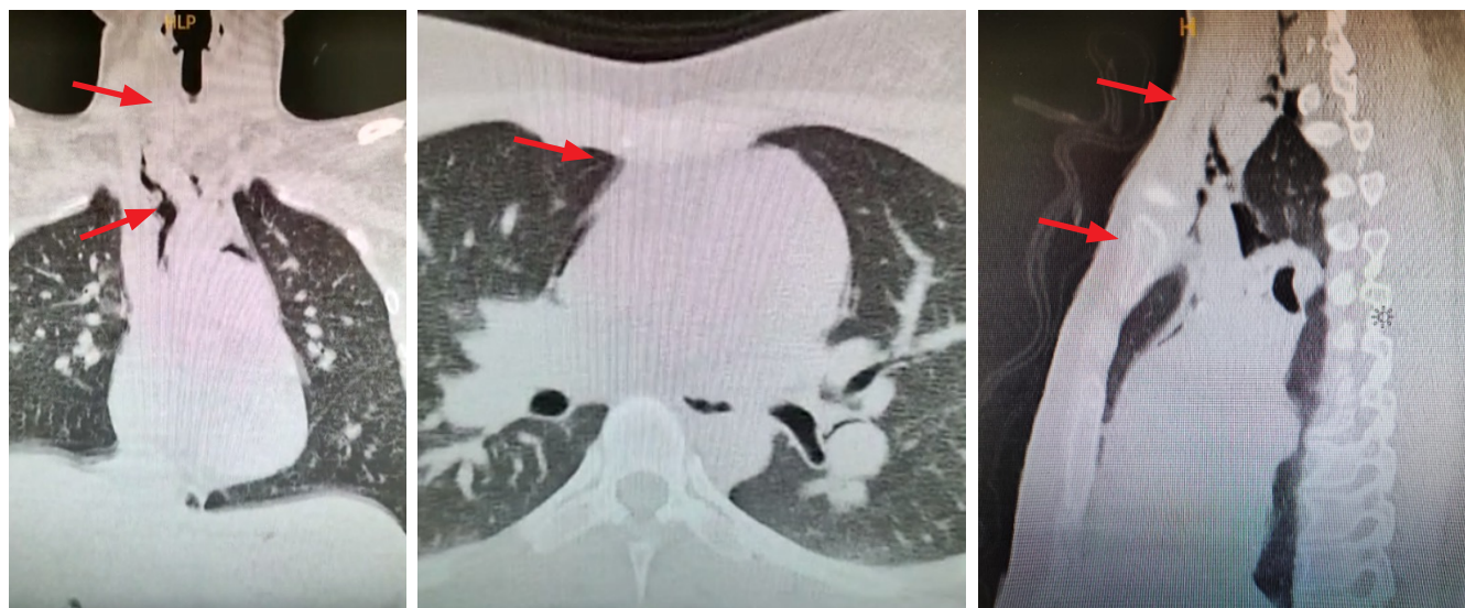
Figura 1 Tomografía de tórax

Otros autores han encontrado relación con la práctica de terminados deportes entre los que destacaría, por su mayor asociación con el cuadro, el submarinismo. Recientemente se han comunicado casos en relación al consumo de